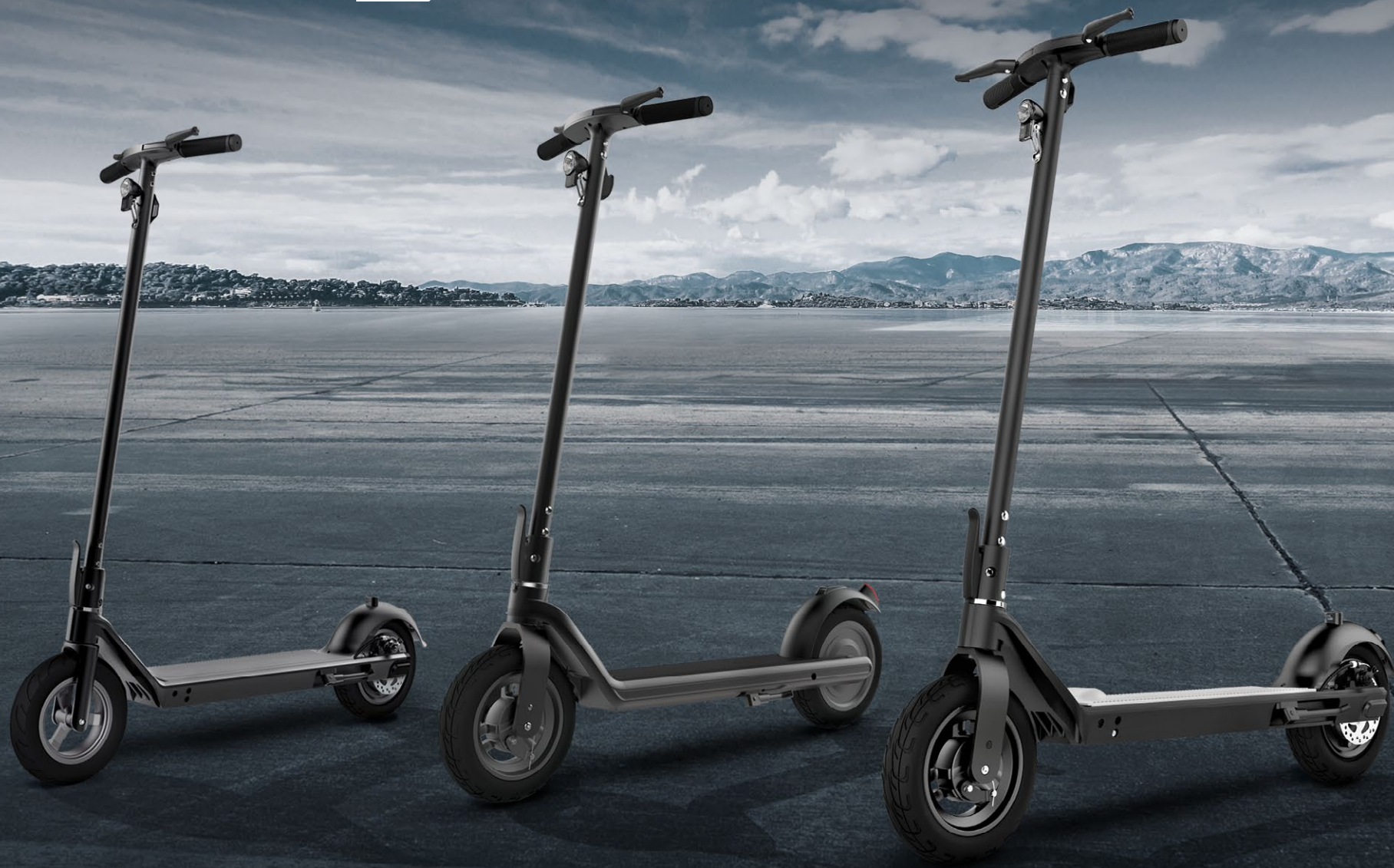
NEOLINE T23 Электросамокат